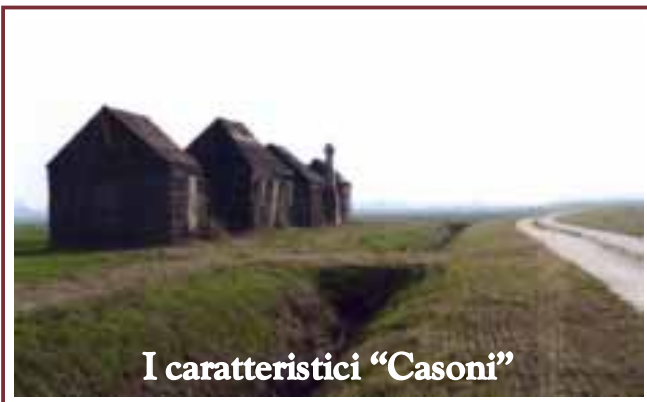
I caratteristici "Casoni"