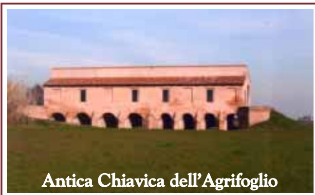
Antica Chiavica dell'Agrifoglio

Per prenotazioni: Sig. PIETRO Cell. 338.7620585